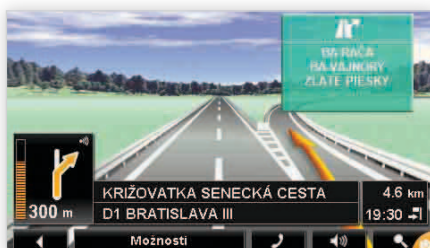
RealityView v praxi na vjazde do Bratislavy z diaľnice D1

výškou podjazdov. Navigačný softvér obsahuje aj databázu POI rozšírenú o špeciálne body zaujímavé pre vodičov nákladných vozidiel, akými sú odpočívadlá pre kamionistov, čerpacie stanice, servisy alebo umývacie linky.