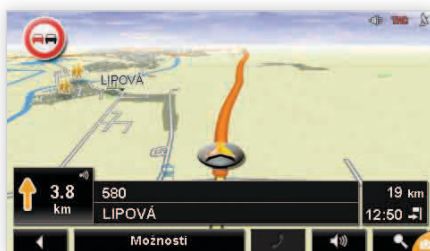
Zobrazenie dopravnej značky zákaz predbehania v ľavom hornom rohu displeja navigácie